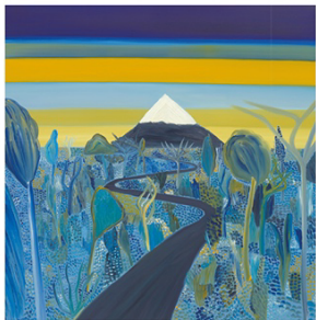
Matthew Wong » 'Unknown Pleasures', 2019.

begin in 2011, op zijn 27ste, met tekenen en schilderen. Vincent van Gogh was een grote inspiratiebron zonder dat hij de Nederlandse meester klakkeloos kopieerde. In enkele jaren tijd werd Wong erg populair bij Amerikaanse verzamelaars en musca. Het Van Gogh Museum toont zijn oeuvre en legt de klemtoon op het verband tussen beide kunstenaars.